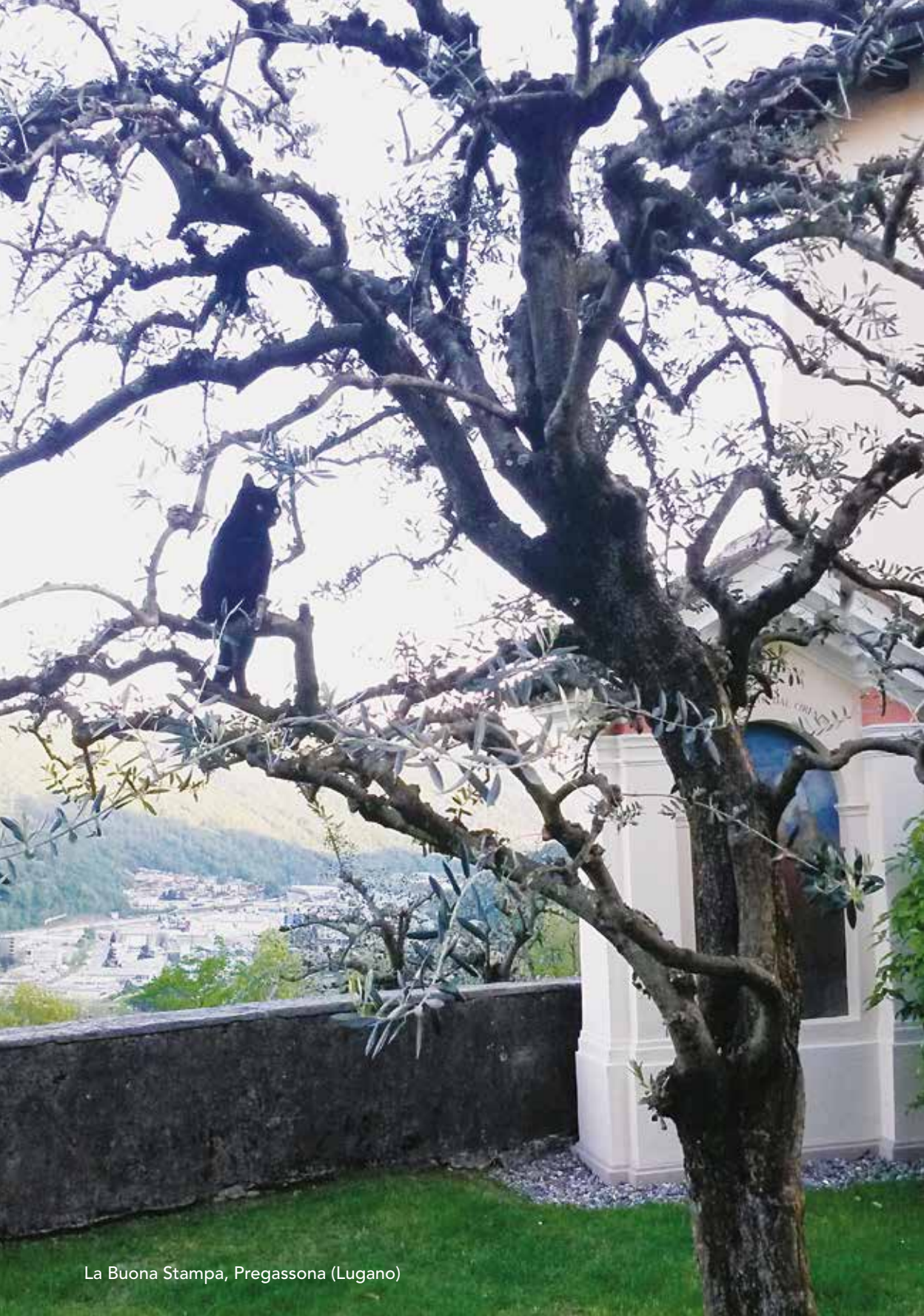
La Buona Stampa, Pregassona (Lugano)