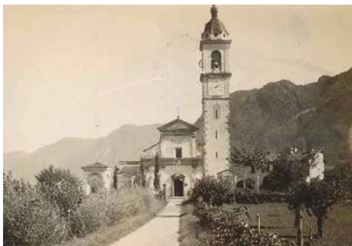
La chiesa di S. Abbondio nel 1927.

Sappiamo però che, escludendo quelle del Vicariato di Bironico, la chiesa di Sant'Abbondio fu tra le prime a staccarsi dalla chiesa matrice di Agno. Questo fenomeno, favorito dall'incremento demografico e materiale dei paesi, diede origine ad altre nuove parrocchie: Sessa nel 1561, Arosio nel 1580, Medeglia nel 1585 e Breno nel 1592, per limitarci al XVI secolo. Nel 1803, insieme al Cantone Ticino, nascono i Comuni politici. I beni parrocchiali, e in particolare la chiesa e la casa del parroco, sono amministrati dai Comuni di Genti-