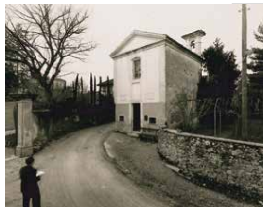
Il vecchio oratorio di S. Mattia a Certenago demolito nel 1937 per consentire l'allargamento della strada cantonale.

I documenti prodotti in tempi più recenti, generalmente riuniti in incarti dagli amministratori parrocchiali, sono più completi e testimoniano soprattutto i numerosi interventi intrapresi per conservare e valorizzare l'importante complesso monumentale di Sant'Abbondio. Pensiamo, in particolare, ai restauri del sagrato, dell'ossario e delle cappelle della via Crucis (1980-1984), ai restauri interni della chiesa parrocchiale (1992-1998), al restauro degli oratori di Gentilino, Viglio e Arasio (1988-1993) e al riattamento e ampliamento della casa parrocchiale (2005-2011).