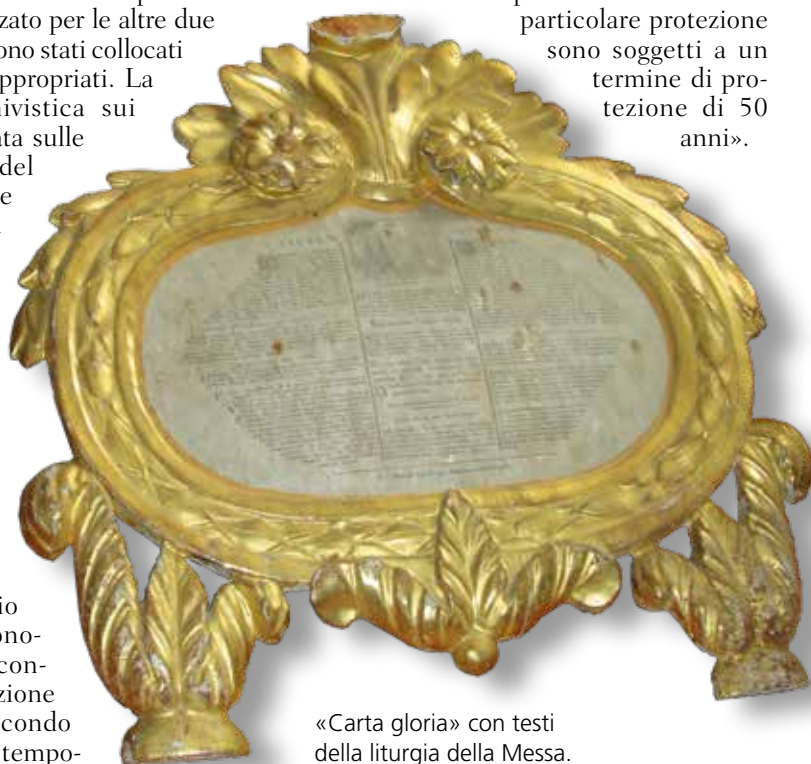
«Carta gloria» con testi della liturgia della Messa.

i «dati personali meritevoli di particolare protezione sono soggetti a un termine di protezione di 50 anni».