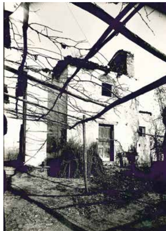
L'oratorio di S. Nazario a Montagnola prima del restauro del 1923.