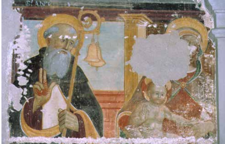
Un frammento dell'affresco presente nella chiesa di S. Abbondio che raffigura S. Antonio abate, presumibilmente cinquecentesco, venuto alla luce durante il restauro interno del 1998.

A ogni unità di conservazione è stata attribuita una segnatura, riportata nell'inventario, per consentire di ritrovare rapidamente la documentazione cercata. I documenti contabili (ricevute di pagamento, fatture,